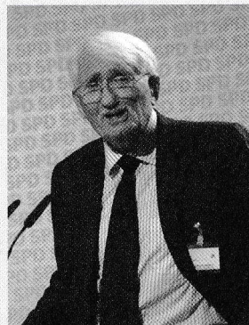
Jürgen Habermas într-o fotografie din 2007

Dintre filosofii contemporani, nu cunosc pe nimeni care să-și fi confruntat colegii timp de decenii cu atât de multe perspective, intuiții și formulări noi [...]. Capacitățile sale coplesitoare datorează multe spiritului romantic al poetului care se ascunde în spațiile filosofului academic. Ironia și pasiunea, tonul ludic și polemic cu care a revoluționat modurile noastre de gândire și a influențat atâtea persoane dovedesc fermitatea temperamentului său. Dar această impresie nu face dreptate naturii amabile a unui om care se dovedea timid și retras, și mereu sensibil la ceilalți [...]. Pentru ironicul Rorty nimic nu era sacru. Când a fost întrebat, spre sfârșitul vieții, despre „sacru”, ateul care era a răspuns cu vorbe care amintesc de un tânăr Hegel: „Părerea mea despre sacru este legată de speranța că, într-o zi, urmașii mei îndepărtați vor trăi într-o civilizație globală în care dragostea va fi, în mare parte, singura lege”.